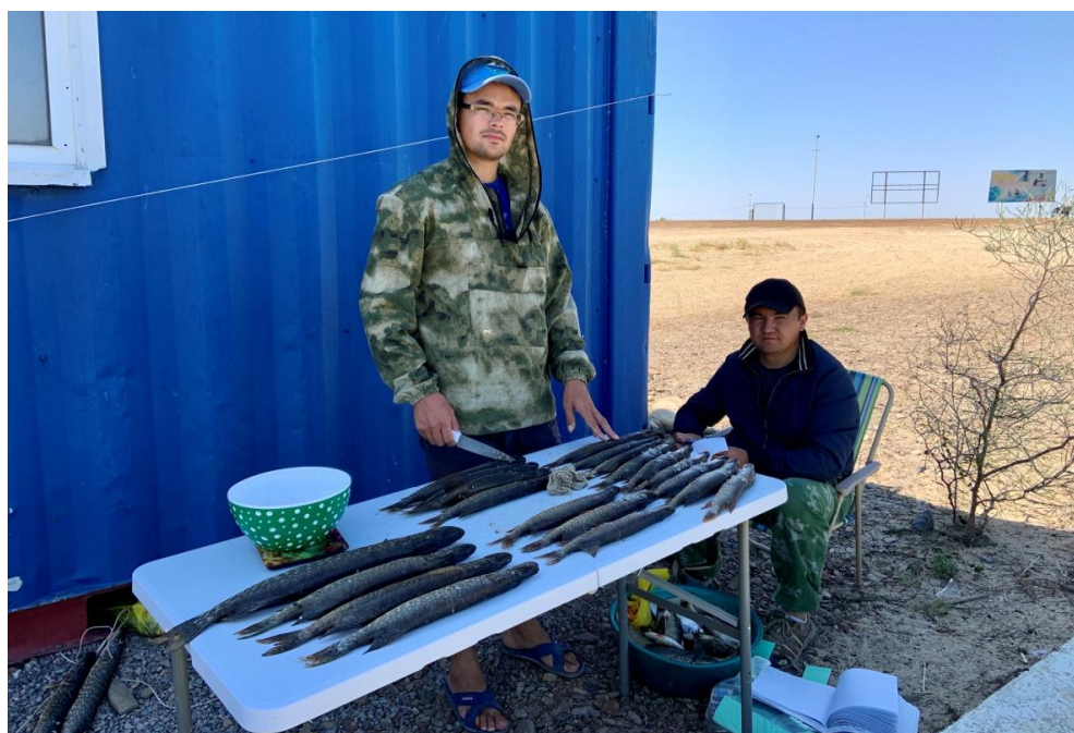
Рис. 2. Биоанализ щуки, выловленной из оз. Караколь

Щука. Распространена в пресных водах Евразии. В научно-исследовательских уловах щука встречалась в оз. Караколь (7 экз.) (рис. 2), оз. Шомишколь (12 экз.) и оз. Туцы (7 экз.). Длина ее составила от 29 до 43,4 см, средняя – в пределах 37 см. Масса от 229 до 792 г, со средней навеской в 440 г (см. табл. 4). Желудки 55 % всех пойманных щук были заполнены креветками, плотвой и атериной. Возрастная структура представлена четырьмя генерациями, среди которых доминировали четырехлетки.